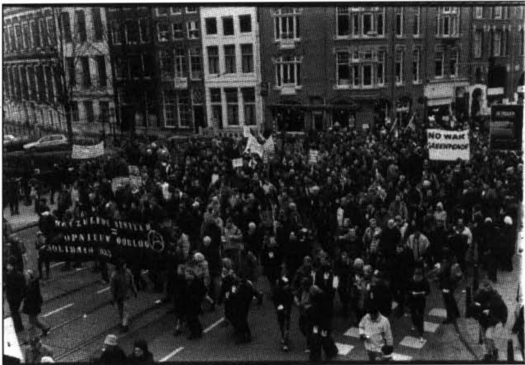
AGA in de demonstratie van 15 februari

AGA vindt net als de secties van de IAA dat de vakbonden voorbereidingen moeten treffen tegen de oorlog. Met het horen van de stemmen in demonstraties alleen zullen