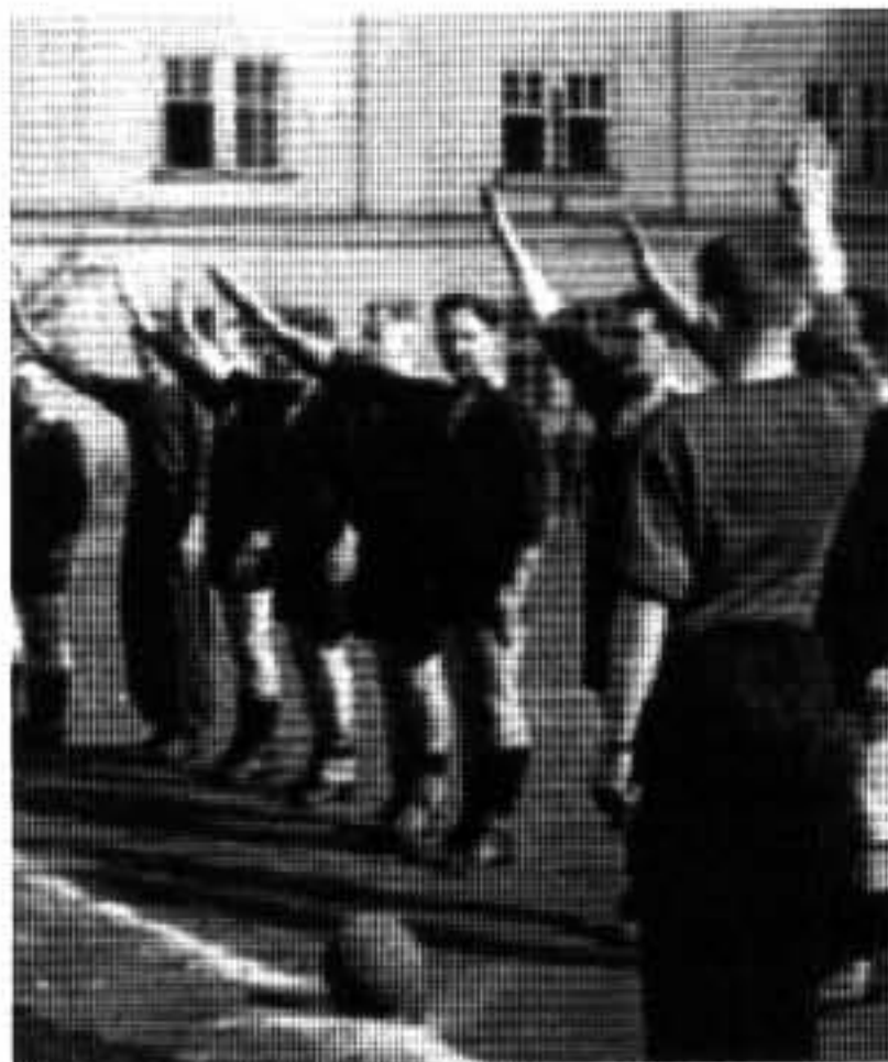
THEY'VE NEVER LEFT US So, what can we do? We cannot allow this kind of "razzia".

It's not easy to be out of your country. There many things that you should learn about the new culture