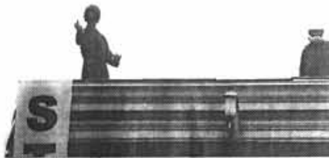
VERDEDIGERS VAN SOCIALE WOONRUIMTE EN EEN BEWOONBARE BINNENSTAD.