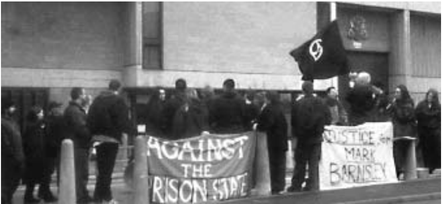
Lawaaidemonstratie bij de Wakefield gevangenis.

genomen. Het eindigde met een protest op het dak waar de gevangenen voor een redelijke tijd in het volle zicht van de media waren. Dat was een afgang voor de Britse Staat, voor het Britse gevangenisstelsel, en dus op dat moment werd er veel over liberalisering van de gevangenis gesproken, over bijvoorbeeld het plaatsen van toiletten in de cellen, dat hadden de Britse gevangenen toen niet, en in sommige Britse gevangenis hebben ze nog steeds geen toiletten in de cel. Over mensen iets vaker uit hun cel te laten, en om alles in het algemeen een beetje meer relaxed te maken. Maar dat was enkel een tactische terugtrekking van de Staat, want rond dezelfde tijd voerden ze nieuwe beveiligingsmaatregelen in. Wanneer er nieuwe gevangenis werden gebouwd werden ze anders gebouwd, ze hadden lagere daken zodat er bij een protest vanaf buiten niets te zien was, ze gingen meer beveiligingscamera's gebruiken, de cipiers kregen meer retraining, en ze ontwikkelden ook een aantal psychologische tactieken die ze later met veel succes hebben ingezet.